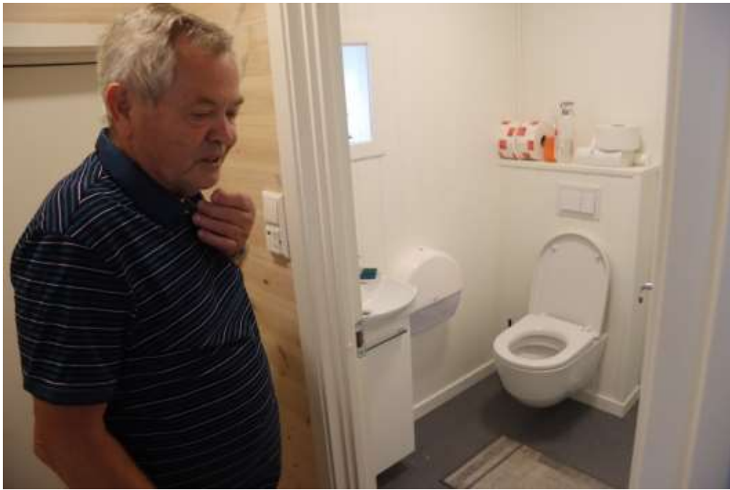
TOALETT: Toalettet er en av flere nye ting i bygget til Jæren kystlag.